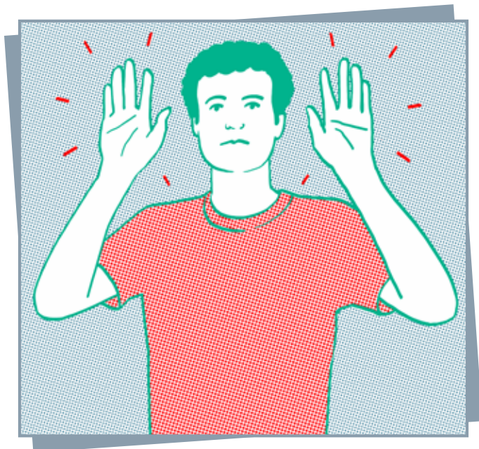
Mains levées et visibles